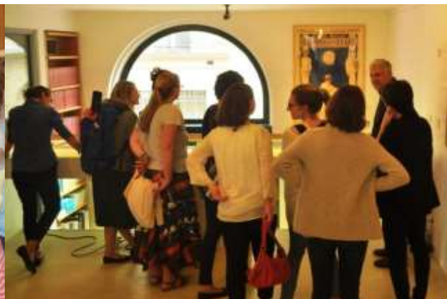
pro děti a pro rodiče...