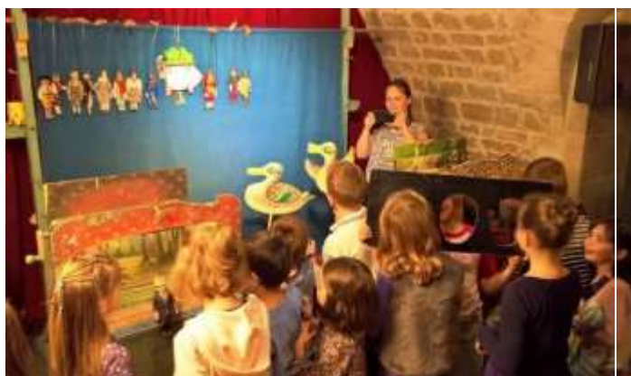
a oblíbené prohlížení loutek a kulis po skončení představení.

Milí rodiče, milí prarodiče, vážení přátelé naší školy,