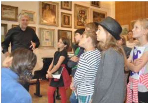
Prohlídka výstavy „Za Československo“ s kurátorem