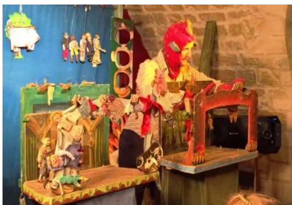
Dvě pohádky na bříše v provedení divadla ANPU ...